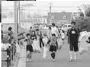
早朝から家族総出で参加してくださいました地区もありました