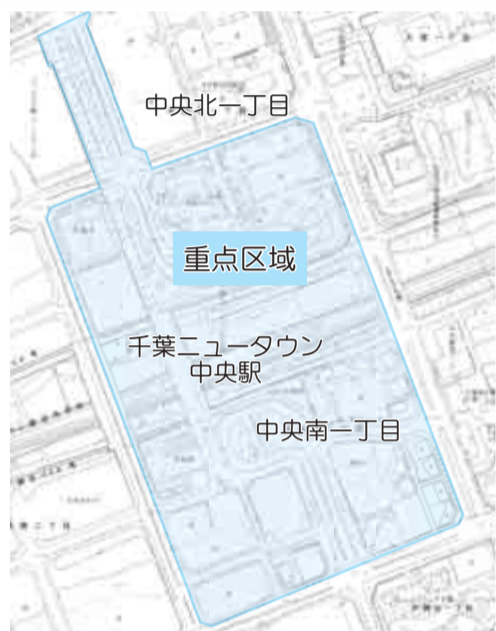
千葉ニュータウン中央駅周辺の部分は重点区域。歩行喫煙、ポイ捨て等防止指導員が巡回を行っています