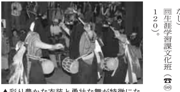
▲彩り豊かな衣装と勇壮な舞が特徴になっている「鳥見神社の獅子舞」

県指定無形民俗文化財 「鳥見神社の獅子舞」 千葉県の無形民俗文化財に指定されている平岡鳥見神社の獅子舞は、ジジ(親獅子)、セナ(若獅子)、カカ(雌獅子)の三匹獅子舞で、悪魔払いと豊作を祈願して奉納されます。 ●家族で勇壮な舞をご覧になりませんか。 ●日時：5月3日(月)・午後1時～。