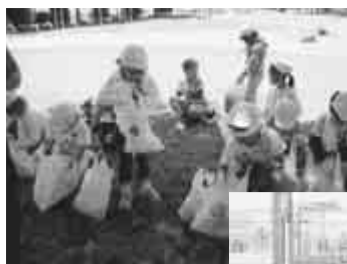
宗像小では毎年クリーン作戦を展開