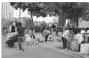
一人ひとりの力を合わせて散乱ごみを無くしていきましょう