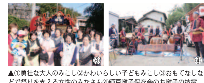
▲①勇壮な大人のみこし②かわいらしい子どもみこし③おもてなしなどで祭りを支える女性のみなさん④師戸囃子保存会のお囃子の披露

夕方6時過ぎ、岡台から神社にみこしを戻す途中は、神様との別れを惜しむように、揺すってもんでの担ぎとなり、揺すって暗の中、ちょうちんで照らされたお宮の中に入ったみこしは、担ぎ棒を外され安置され、神事後、直会で祭りにかかわった人々たちをねぎらい終了となりました。 師戸囃子保存会のみなさんは、現在11人。年間60回位の練習を重ね、定期的に研究調査・研修・視察などを行いながら、後世に継承・保存していきけるよう活動されています。 今回取材で、師戸の人々のきずなの強さと懐の深さを感じた1日でした。みなさんも3年後ぜひ足を運んでみてください。きっとすてきな1日になると思います。