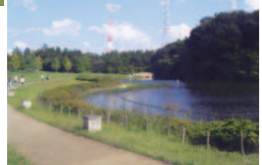
広々とした芝生広場と池

「花と緑のフェスティバル」が開催中。草花の即売会、ハングングバスケットの展示会、ドングリのワークショップ、コンサートなど多くの行事があります。 訪問した日は、ちょうどウが姿を見せます。また、園内には花と緑の文化館があり、毎月各種の講習会、教室、展示会、コンサートが開催されています。 「花と緑のフェスティバル」が、12日には公園ポランテアが育てた赤ソバが食べられるそうです(先着順)。 最後に、この日試飲されていた、血液がサラサラになるというおいしい赤そば茶をご紹介します。楽しく勉強になる公園ですので、ぜひみなさんも訪ねてみてはいかがでしょうか。 千葉県立北総花の丘公園管理事務所(☎4031)。 ※花と緑の文化館の開館時間は午前9時～午後5時。毎月第二水曜日が休館(園内は年中無休)。