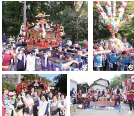
▲①勇壮な大人のみこし②かわいらしい子どもみこし③おもてなしなどで祭りを支える女性のみなさん④師戸囃子保存会のお囃子の披露

子どもたちによる太鼓体験教室を行いました。各休憩所では女性陣が大活躍、彼女たちが作ったとてもおしい、お