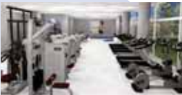
▲トレーニングルーム(イメージ)

約350㎡のスペースに、ランニングマシンや筋力トレーニングマシンなど40台を設置予定。利用するには、事前に利用者講習会の受講が必要です。 ※詳しくは市ホームページをご覧ください。 園スポーツ振興施設管理班(松山下公園総合体育館内・☎8417)。