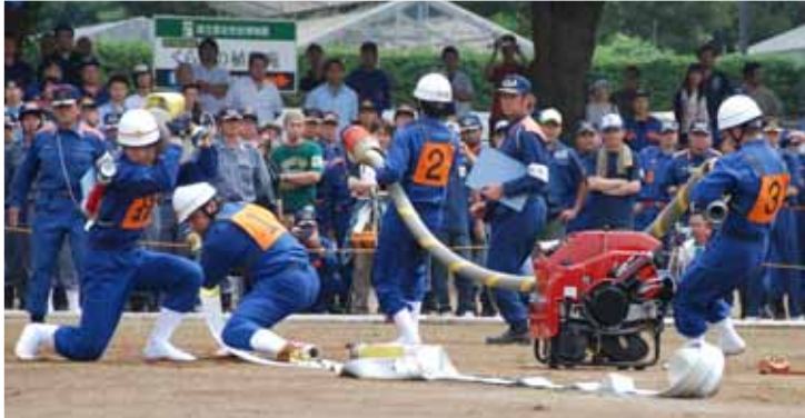
←糸乱れぬチームワークで小型ポンプの部優勝の印旛支団第4分団第10部