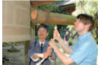
松虫寺の境内で鐘突きを体験