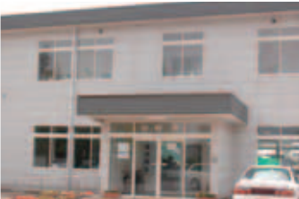
分庁舎には現在、教育委員会が移動

「この支所は、建物も古く、現在のところバリアフリーへの対応など課題が残っていますが、駐車場も広く、ひとつのフロアで、手軽に手続きを行うことが出来ます。毎週土曜日午前8時30分から正午まで開庁しており、住民票・戸籍・印鑑証明発行などの業務を行っています。職員一同、市民のみなさんに気軽にお越しただける施設を目指して頑張っています」と明るくお話しくださいました。ご協力くださった印旛支所の職員のみなさん、ありがとうございました。