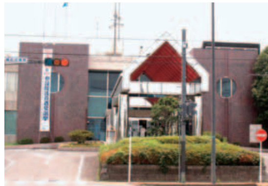
印旛支所の庁舎外観

昭和48年10月に完成した印旛支所は、地上二階・地下一階で、現在は主に一階部分を使用しています。同じ敷地内の分庁舎には、本庁舎改修工事のため教育委員会が入っています。まず、支所入口を入って右手には、市民のみなさんの生活全般に関する、戸籍・健康保険・税・福祉などを取り扱っている「市民福祉課」があり、左手には「総務課」「地域づくり課」、税の収納窓口があります。