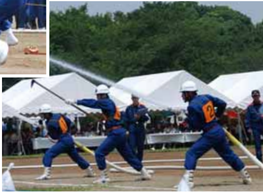
▶訓練の成果を十分に発揮した印旛支団第1分団はポンプ車の部で優勝