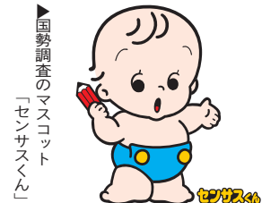
国勢調査のマスコット「センサスくん」

※回収の際、調査員が記入内容を確認することはありません。なお、提出は配布された「郵送提出用封筒」を使い郵送することもできます。