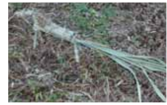
マコモで作られた馬。竹 飾りの根本につながれます