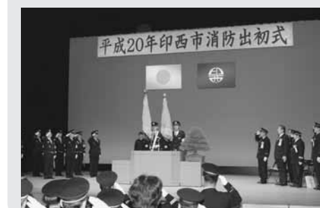
▲今年は松山下公園総合体育館で開催します(写真は平成20年に文化ホールで開催したときのもの)

新春にあたり、消防職団員の士気高揚を図り、職務遂行への決意を新たにするため、下記のとおり「平成23年印西市消防出初式」を開催します。 ●日時…1月8日(土)・午前10時～。 ●会場…松山下公園総合体育館(浦部)。 ☎ 453。