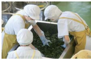
▲調理員さんが心を込めて調理しています