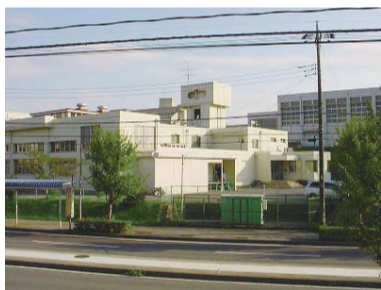
▲高花学校給食センターの外観

高花学校給食センター(高花1-1)は、印西地区内12の小学校の給食を調理する施設です。昭和59年に設立され現在、年間190日間、毎日3,400食分の昼食を調理配送しています。