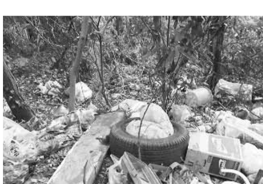
適正な管理で不法投棄を未然に防ぎましょう

家庭から排出される食用油(廃食用油)の拠点回収を実施中 家庭で使用した食用油は、石けん・インク・家畜の飼料・燃料などの原料としてリサイクル