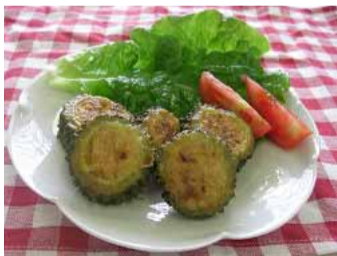
★肉詰め焼き1人分の栄養価★ エネルギー 74kcal、たんぱく質 6.6g、脂質 2.2 g、カルシウム 15mg、塩分 0.9 g

これから厳しくなる暑さに向かって、ポテチユラカは日々、花の数を増やしながらカラフルなじゅうたんのような花壇となって市民のみなさんの目を楽しませてくれるでしょう。