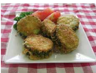
★メンチカツ1人分の栄養価★ エネルギー 191kcal、たんぱく質 8.6g、脂質 11.7 g、カルシウム 21mg、塩分 0.4 g