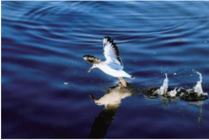
◆佳作 ◆捕ったぞー (発作橋) ◆太田克己 (木下東)