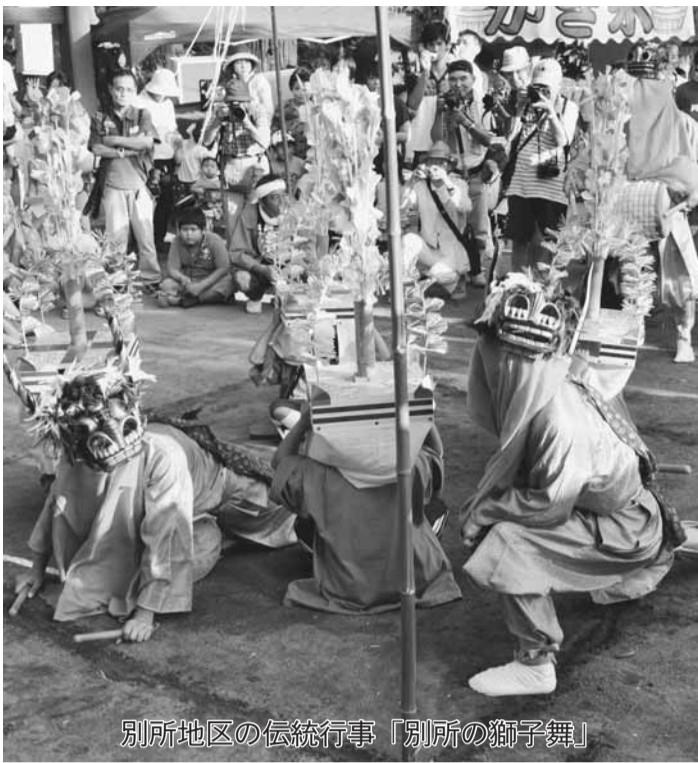
別所地区の伝統行事「別所の獅子舞」