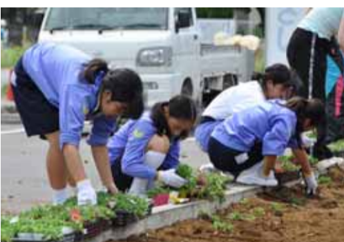
梅雨の合間の去る6月21日、今年も印西中学校の1年生2クラス64人が、文化ホール北側の駐車場周りにポテチユラカを植えてくれました。当日はやや風があつたものの立っているだけでも汗が出てくる陽気でしたが、生徒のみなさんは一株一株丁寧に土を振り植え付け作業を行い、約1時間後にはきれいな花壇ができました。

Q給食センターで使用している食材の産地は公開しないのか。 A現在、学校給食で使用している食材は、安全が確認されたものを使用しています。 特に生鮮食品については、より新鮮なものを提供する観点から、調理日の搬入になっていきます。そのため、産地については、事前に公表することができません。ホームページで使用した食材の産地について公表します。 ※2ページへ続く。