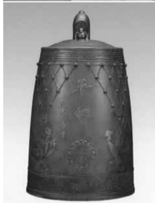
▲故 香取正彦氏 (人間国宝) の手による「印西平和の鐘」