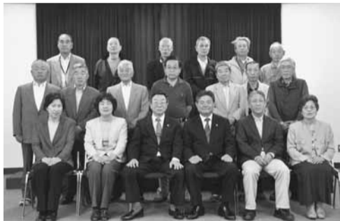
▲印西市防犯組合岩戸支部のみなさんと山崎市長（最前列中央右）