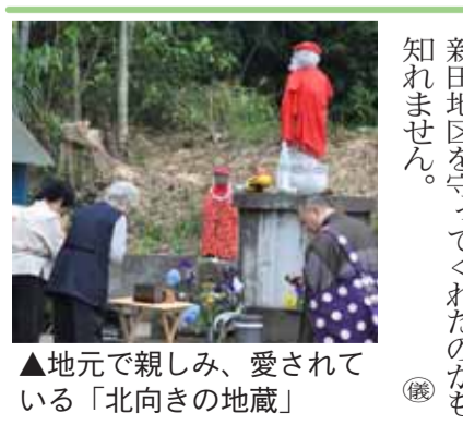
▲地元で親しみ、愛されている「北向きの地蔵」