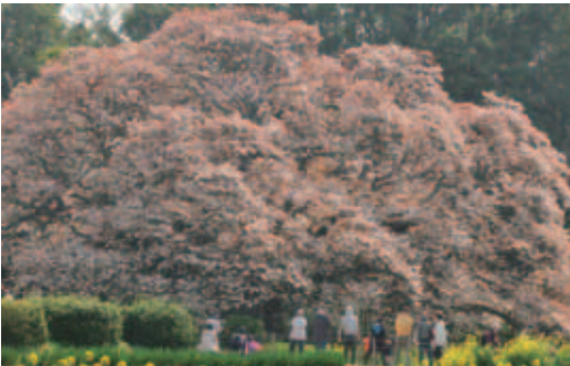
満開の時期の「吉高の大桜」。樹高10・6mの大きさをほこります

その一本桜を見るにはちよつとした試練があります。毎年、街中のソメイヨシノが満開を過ぎる4月中旬。樹齢300年を超えるといわれている「吉高の大桜」は、大きく広げた枝の先に花芽を膨らませ始めます。駐車場として開放される印旛中央公園(瀬戸1518)から徒歩約20分。試験とはいえないものの、春の日の中、ウグイスの声に歓迎された、気持ちの良い行程です。ほどなく、林に囲われた畑の中に、言葉に尽くせない気品を漂わせるヤマザクラの大きな樹形が、姿を現します。これが市の天然記念物「吉高