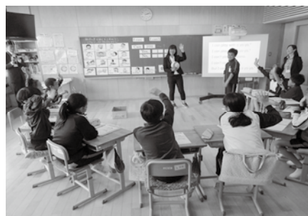
▲外国語活動授業研修会