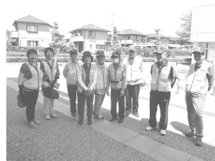
(地域安全パトロール隊)