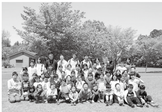
( 全校遠足 )