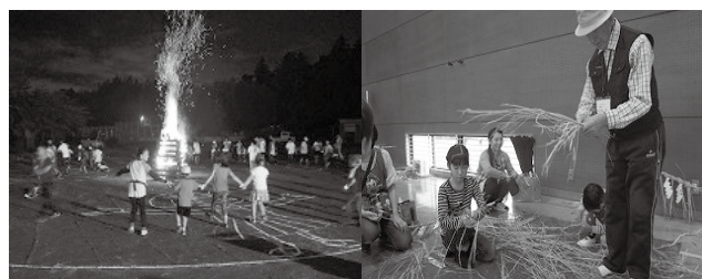
▲PTA主催の校内キャンプ ▲もといち祭

小規模校のメリットを最大限に生かし、全校体制で児童一人一人の教育的ニーズに応じた教育を推進している。また、体験と交流の充実を通して学ぶ機会を大事にするとともに、全校縦割り活動や本埜第二小との交流を通して、多様な集団活動の充実に努めている。