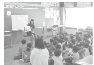
(図書ボランティア)