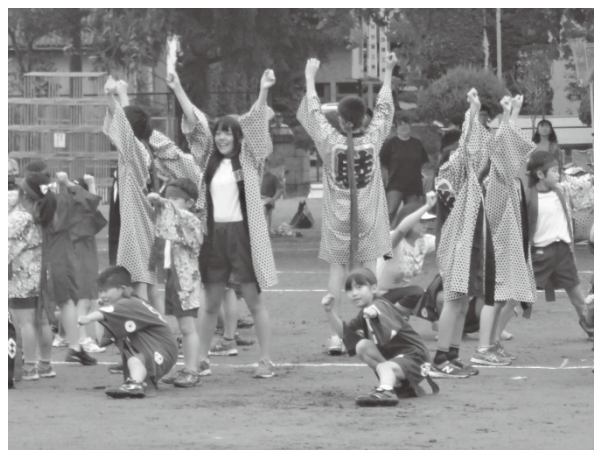
▲平成28年度 運動会「宗像ソーラン」