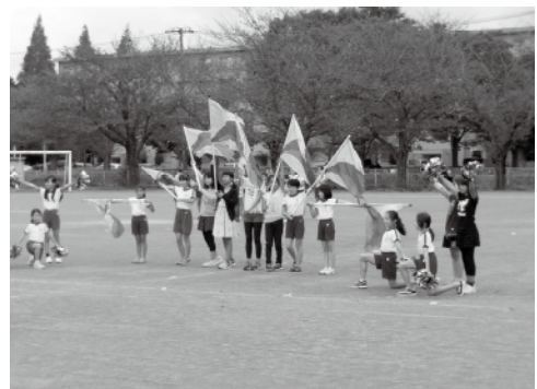
(マーチング練習風景)