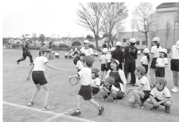
▲遊・友スポーツランキング練習