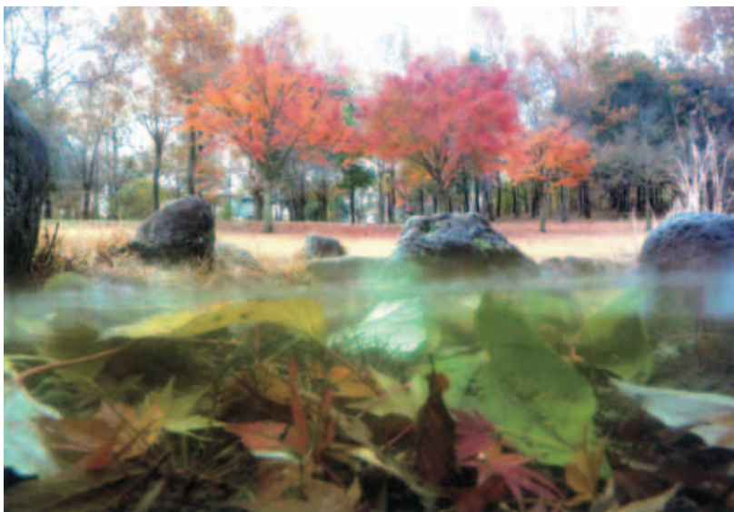
◆優秀賞 (評) 正面に見える水中紅葉と、背後で色づく木々のコントラストが秀逸。 ◆水中紅葉 (北総花の丘公園) ◆工藤 薫