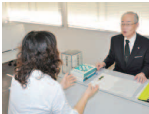
▶各分野のエキスパートが相談に応じます(写真は市民生活相談の様子)