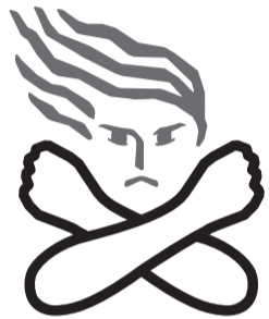
女性に対する暴力根絶のためのシンボルマーク

また、男女共同参画社会を形成していく上で克服すべき重要な課題でもあります。 市では毎月第1、第3木曜日