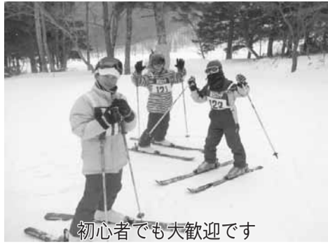
初心者でも大歓迎です

場日光湯元スキー場。※宿泊は、奥日光小西ホテル(栃木県日光市湯元・☎0288-6212416)で往復は大型バスを貸切ります。市内在住・在勤・在学中で、小学1年生以上の親子。中学生以上18,000円、小学生16,000円。(4人1室の宿泊料、バス代、行事保険料含む)そのほかの食事、リフト券、レンタル料金は別途。定35人程度。