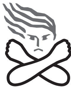
▲女性に対する暴力根絶のためのシンボルマーク

夫やパートナーからの暴力、性犯罪、売買春、セクシュアル・ハラスメント、ストーカー行為などは、女性の人権を著しく侵害するものであり、決して許されるものではありません。また、男女共同参画社会を形成していく上で克服すべき重要な課題でもあります。市では毎月第1、第3木曜日