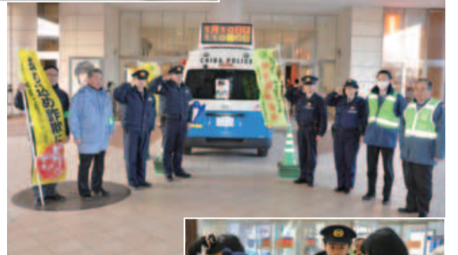
▶地道な呼びかけが事件防止につながったことも