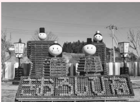
▲多くの人たちに愛されるビッグ雛たち今年が最後のお披露目です

今回が最後の開催となる「ビッグ雛まつり」。日本最大のおひなさまが、1万株のピオラの衣をまとい、みなさんの来場を待っています。開催中にはピオラの販売も行っています。ぜひお越しください。