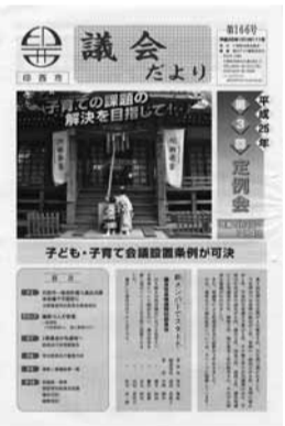
▶あなたの写真もぜひ一面に