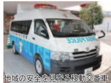
地域の安全を見守る移動交番車