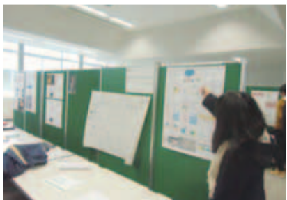
▲基礎プロジェクトでの発表の様子。どの発表も熱心に行われました

葉ニュータウンキャンパス(武西学園台2-1200)です。同大学は、明治40年に東京市神田区に創立した電機学校が始まりで、昭和24年の学制改革で理工系の大学となり、平成2年に千葉ニュータウンキャンパスを開設。平成13年に現在のキャンパスに情報環境学部が設置されました。東京ドーム4.5倍の同