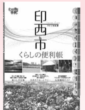
▲各世帯に1冊ずつお届けする「印西市くらしの便利帳」

『広報いんざい』12月1日号でお知らせしましたが、市役所の窓口業務や行政情報のほか、市内の観光スポットなどの地域情報や医療機関情報などを1冊にまとめた「印西市くらしの便利帳」を配布しました。