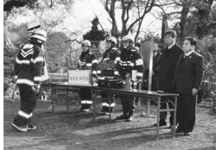
▲訓練には板倉市長、大木教育長(最右および左隣り)も出席