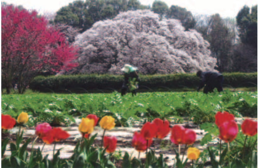
◆優秀賞 ◆桜咲く里 (吉高) ◆大澤 勝臣 (埼玉県春日部市)

(評) 冬が終わり、農作業を始める春。色とりどりの花々が始まりに花を添えている。