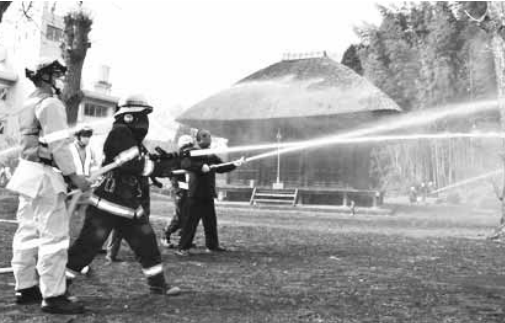
▲訓練は付近での山火事発生を想定して実施(写真中央が薬師堂)