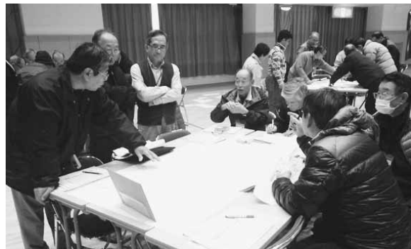
▲避難所の運営ゲームを体験する自主防災組織代表者のみなさん

去る2月2日、本荘公民館で、地域防災の要となる自主防災組織の代表者を対象に、災害時に