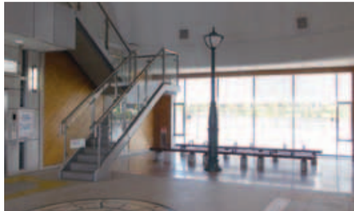
▲心和展望台下の休憩スペース

ることから、「関東の駅百選」に選ばれました。独特な外観は、千葉ニュータウンのコンセプト「RURBAN」に相応しい森の中に佇む駅をイメージし、駅周辺の森には「森に流れる自然の刻」と駅が存在により導かれた「時間」という概念の新たな時々の二つの空間として位置づけるものとして、時計台(森、時、ランドマーク)、ドーム(森、自然の流れ、集いの開放空間)、大屋根(大地、丘、民家の暖かさ)などを意図して表現されています。さらに自然素材を使うことで周辺の自然環境に馴染み、利用者の印象に残ると共に、住民などには誇りに思えるデザインを目指して設計されました。利用者数は現在、