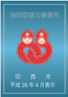
▲ ハート型は地域を思う心を表現しています

この制度は、次の①～⑤のいずれかの認定基準を満たす市内の事業所に「消防団協力事業所表示証(左図)」を交付するもので、事業所に掲示するほか、ロゴはホームページや従業員の名刺などにも掲載できることから事業所の社会貢献が広く認められ、信頼性向上やイメージアップにつながります。消防団の活動にご協力をいただける事業所のみならず、防災課までご連絡ください。