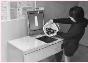
▲設置された生ゴミ処理機

実証実験は、小倉町の「千葉ニュータウントリアス管理組合」の協力の下、敷地内のごみ集積所に生ごみ処理機を設置して、家庭から排出される生ごみの減量・資源化を図りながら、その減量効果などを検証し、今後の事業展開を検討していくものです。