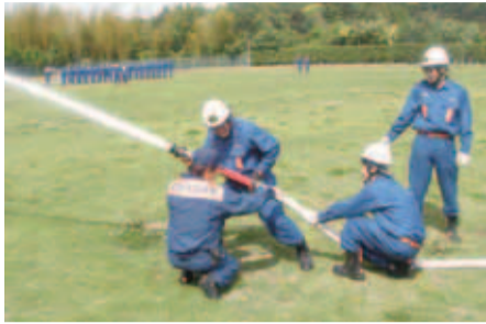
▲ 消防職員より放水姿勢の指導を受ける消防団員

消防団は、常備消防として消防署に勤務する消防職員とは異なり、火災や災害が発生した際には自宅や職場から現場へ駆けつけ、消火活動や避難誘導などを行う地域のボランティア的存在です。団員の多くは会社勤務めながら、また子育てをしながら活動しています。