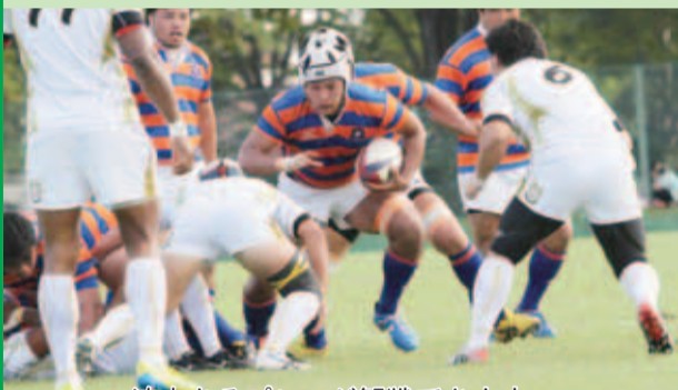
迫力あるプレーが観戦できます

今年も「千葉県ラグビーまつり in 印西」が松山下公園陸上競技場(浦部)で開催されます。今年メインカードは、関東大学リーグ戦1部に所属する「流通経済大学」対「法政大学」(午後2時キックオフ予定)です。そのほかクラブチームやラグビースクール、女子15人制の試合が行われます。