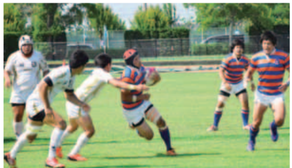
▲流通経済大学(白)と法政大学(オレンジ)の白熱した試合43対21で流通経済大学の勝利

ンドから格闘技魂に火が付ければ、その衝動のままグラウンドに。まず、女子の日本大とGRACE RKUの試合は男性顔負けの猛烈タックルで度胆を抜かれ。スクラムは溜め込んでいた息を一気に吐き出す「ウッ!」という押し殺した声とともに肉体の激突。次から次へと繰り広げられる激しい攻防戦に飛び散る汗。女性パワーに圧倒された瞬間でした。 メインイベントの男子の流経大と法政大の試合ではさらにヒートアップ(自身を含めて)し、暑さを忘れるほどの小気味良いパス廻し。タックルなどは受け身を一步間違えると大けがを予想させる豪快なもの。鍛