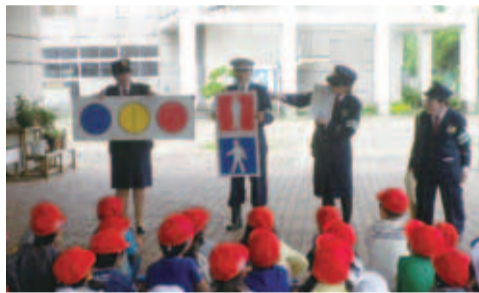
▲▲小学校の交通安全教室の様子、交通ルールやマナーを学びました