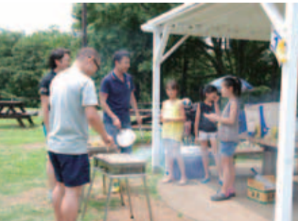
▲笑顔集まる、バーベキュー場

の中のつどいの広場(1,800㎡)にあり、このゾーンは緑豊かな大自然公園、隣接する東京基督教大学から鳴る鐘の音が聞こえる。まるでドイツの公園にいるような気分を味わうことができます。利用できる期間は、4月~11月の土・日曜日・祝日と夏季8月1日~31日(月曜日休業)です。