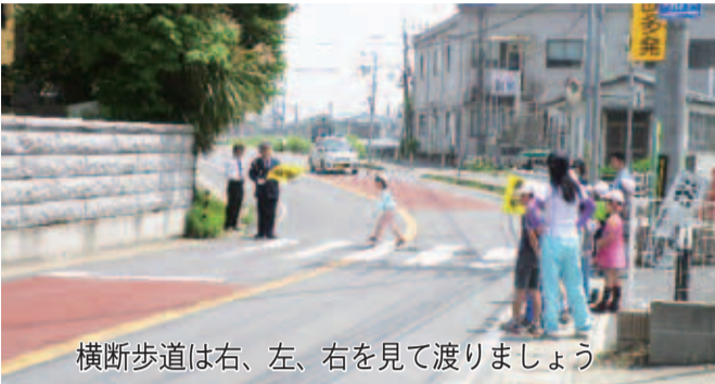
横断歩道は右、左、右を見て渡りましょう