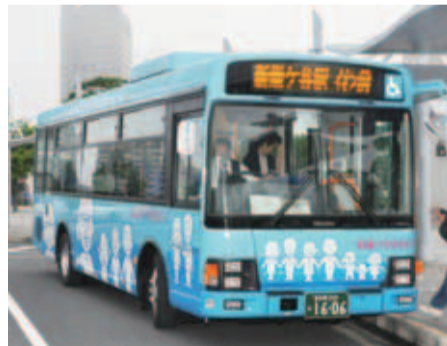
▲3世代が笑顔で手をつなぐイラストが描かれた「生活バスちば(とう)」

●運行日：土曜・日曜日および祝日。 ●運行ルート：高花～千葉ニュータウン中央駅(南口ロータリー)～新鎌ヶ谷駅(北口ロータリー)。 ●バス運行のお問い合わせは左記へ。 ■ちばレインボーバス株式会社(☎0022)。