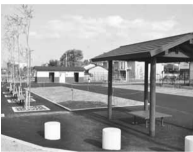
▲工事のため一部が利用できません

【広場の利用について】経済政策課地域資源振興班(☎内線352)、【排水工事について】下水道課工務管理班(☎内線785)。