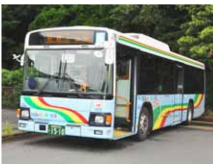
▲「ちばレインボーバス」といえば、おなじみの虹色が特徴です