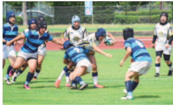
▲日本体育大学(青)とGRACE RKU(白)の熱のこもった戦い38対5で日本体育大学の勝利

梅雨まっただ中のラグビーまつりは、すっきりとした晴天に恵まれた気温38℃真夏日の無風状態。「こんな日にラグビー?」と思わず…。このラグビーまつりは、平成3年に始まり今回で24回目。そして屋根なしスタンドはラグビーファンで熱気ムンムンの満席状態。 当日の対戦カードは、40歳前後のおやしチーム親善試合。チビッ子ラガーマンの未就学児とママたちのラグビーゴッコ。小学生の各ラグビース