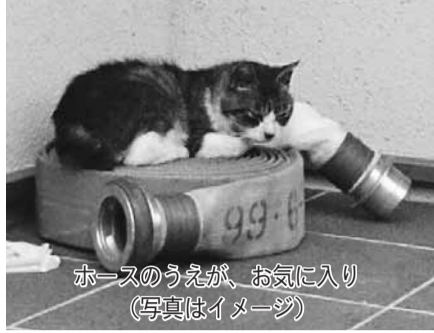
ホースのうえが、お気に入り(写真はイメージ)

わが家の愛犬・愛猫の写真にコメントを付けて紹介してください。優秀作品 15 点を 9 月に行われる動物愛護週間イベント会場に展示し、協会理事長表彰式を行います。