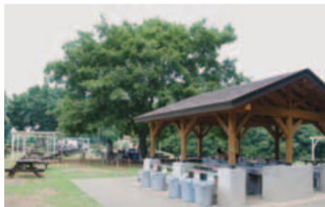
▲気軽に、バーベキューが楽しめます

「北総花の丘公園」(原山1-12-1)は、千葉県立都市公園のひとつとして、5つのゾーンに分かれた総合公園で平成21年4月に全面オープ