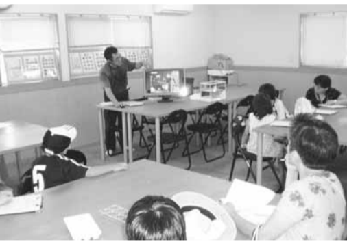
▲ごみや資源物の処理方法を分かりやすく説明

【バス】移動中に車中でクイズなども行います。また、学習シートを配布するので、夏休みの自由研究として活用できます。案内役は市民活動団体「温暖化防止印西」が務めます。