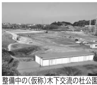
整備中の(仮称)木下交流の杜公園