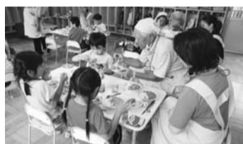
保育園の昼食風景