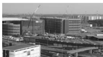
泉野地区で建設が進む企業ビル