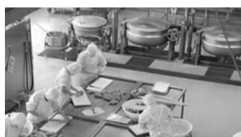
給食センターの調理風景