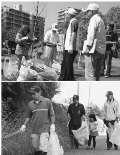
小さなお子さんから年配者まで、みなさんに参加していただきました