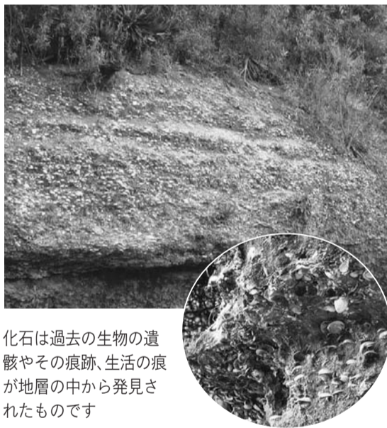
化石は過去の生物の遺骸やその痕跡、生活の痕跡が地層の中から発見されたものです