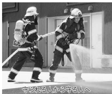
守られる人から守る人へ