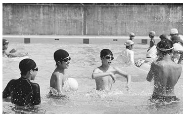
水しぶきが涼をさそいます

●勤務時間：①平日・午前7時～午後7時、土曜日・午前7時～午後7時。 ●任用期間：委嘱の日から2年。 ●報酬：月額5,000円。 ●市の国際化に関する取り組みについて、意見交換を行います。 ●平成28年7月1日現在で、満20歳以上の市内在住の人で、年数回の会議(原則として平日の昼間に開催)に参加ができ、国際化推進について意見を述べるこ