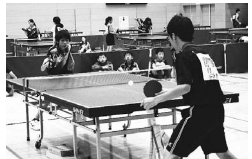
空気が張り詰めるスピード感

9月18日(日)・9時30分。 松山下公園総合体育館。 個人戦。一般女子はダブルス