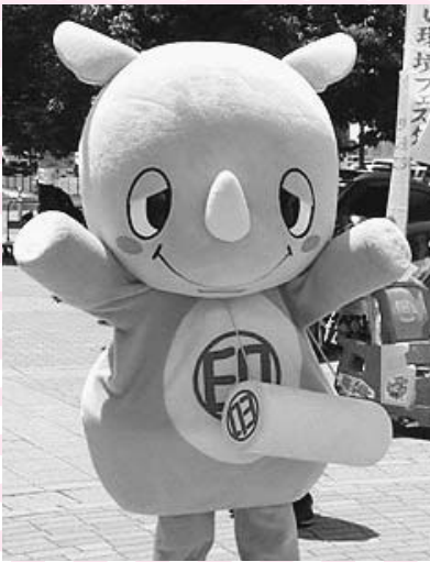
みんな投票してください!

現在、ゆるキャラの祭典「ゆるキャラグランプリ 2016(ゆるキャラ(R)グランプリ実行委員会主催)」が開催中。投票を受け付けています。市のマスコットキャラクターいんざい君もグランプリを目指してがんばります! 1日1回投票できるので、たくさん投票して応援してね。