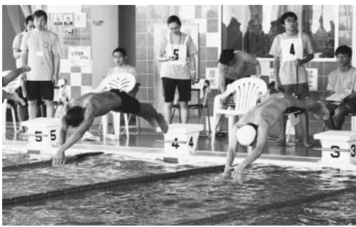
あなたの実力を試しませんか