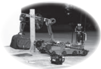
無人処理機で不審物件を除去