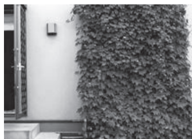
緑が涼感を呼びます