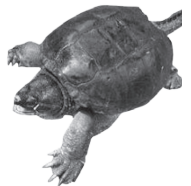
どう猛な性格で、鋭いツメが特徴