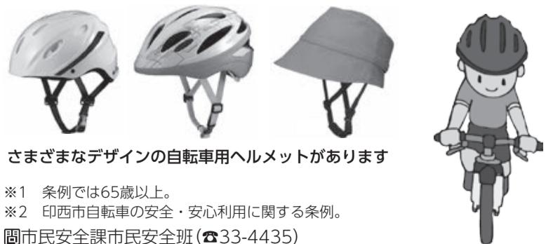
さまざまなデザインの自転車用ヘルメットがあります

ヘルメットは、転倒したときに衝撃から頭を守ってくれます。自転車乗車中の被害を軽減するためにもヘルメットをかぶりましょう。