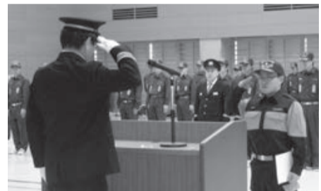
地域を守る新たな団員