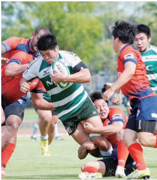
力と力の真剣勝負!

トップリーグに所属する「パナソニック」対「NEC」と女子ラグビー7人制の2試合を予定しています。