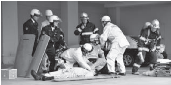
関係機関と協力・連携した救出救助訓練

4月21日、市役所庁舎に対する爆破予告メールを受けたことを想定し、市役所、印西警察署、県警本部機動隊、印西地区消防組合が合同で県内では初となる市役所庁舎での訓練を実施しました。 訓練では「市国民保護計画」に準じ、対策本部を立ち上げ、市職員による自衛消防隊の避難誘導訓練、警察・消防による緊急出動訓練、合同指揮本部訓練、救出救助訓練、県警本部機動隊による不審物除去訓練を行いました。 県内で初となった訓練は緊張感あふれる本番さながらの訓練となりました。 国防防災課防災班 (☎33-4404)