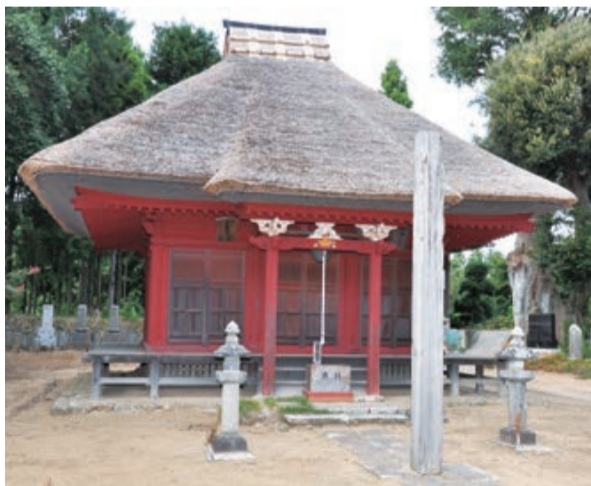
県内最古の建造物(国指定重要文化財)

稚児行列に参加を希望する人は栄福寺薬師堂ホームページ ( http://www.eifukuji.jimdo.com ) へ「確認」してください。 11月12日(日)・【稚児行列】10時～ 【ご開扉】11時～