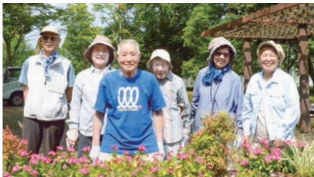
会員の皆さん 最高年齢は99才

(評)印西に眠る宝物を探して、小さな探検家がヒガンバナの咲く小路を進む。その両手に夢の双眼鏡を携えて、覗き込むのは大きな黒いアゲハチョウ。印西の宝物の1つ「豊かな自然」を発見!