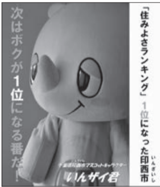
いんざい君応援ポスター

◎投票方法など…ゆるキャラグランプリ2017公式ホームページをご覧ください 問 経済政策課地域資源振興班 ☎33-4477