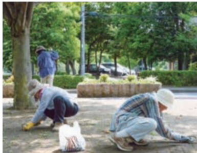
ブロックの隙間の草取りは根気が必要

公園を花で彩りたいと思うたのがきっかけで、20年以上前から高花公園などに四季折々の花を咲かせつつ、公園の清掃などの美化活動をしている「花の会」。 現在の会員は70歳代を中心に7人。公園に訪れる人に季節の花を楽しんでもらおうと、熱心に花壇の手入れや草取りなどを行っています。 昨年6月には、その功績が