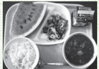
印西産のスイカを給食に提供

地産地消とは…地元で生産された農産物などを地元で消費しようという取り組みのことです。市の給食では、地元の旬な食材を取り入れています。