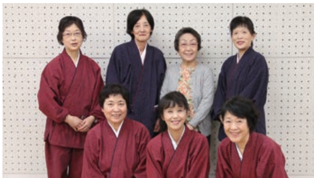
素敵な笑顔の会員の皆さん

(評)夕闇に浮かぶ富士山の雄大さを見せつつ、街を包む明かりを使い、印西市の賑わいを捉えた1枚。道路を走る車のライトも、シャッタースピードを操作し、美しく仕上がっている。