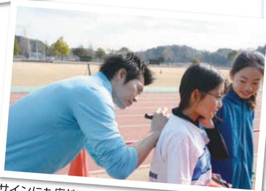
サインにも応じてくれました