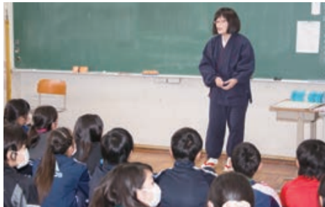
聞く人の想像を広げる作務衣の衣装