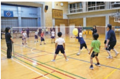
世代を問わず楽しめます