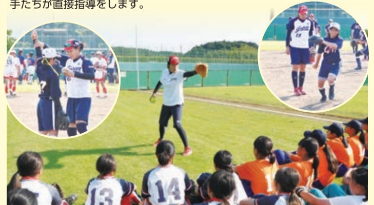
写真は一昨年の日本代表による教室の様子

市内外から100人を超える中学生たちが球場に集まり、カナダ代表の選手たちが直接指導をします。