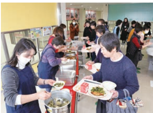
配膳の体験もできます