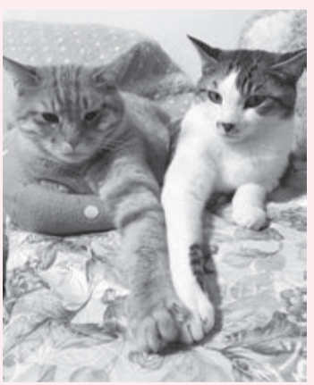
責任と愛情をもって飼いましょう