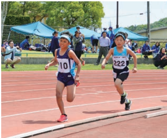
ラストスパートは自分との戦い

当日は市内外から800人を超える選手が参加し、110mハードル走をはじめ中長距離走や棒高跳び走り幅跳びなど、フィールドの内外で、真剣勝負が繰り広げられました。