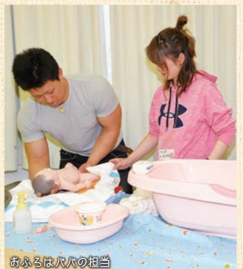
おふるはパパの担当