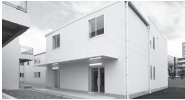
小倉台小学校に8クラス分の校舎を増築