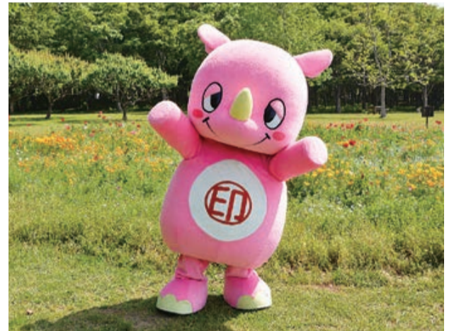
おさんぽいんザイ君の様子をツイッターで発信中

5月1日は「千葉県立北総花の丘公園」(原山)におさんぽに出かけたいんザイ君は、初夏の日差しが降り注ぐなか、遠足に来ていた地元の小学生と一緒に遊んだり写真を撮ったりして楽しんでいました。