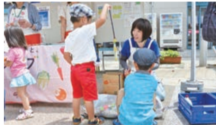
楽しみながら学べます

他にも、環境紙芝居やリサイクル品の抽選会など、子どもから大人まで楽しみながら学べるコーナーが盛りだくさん。この機会に家族で環境を守る大切さを感じてみませんか。