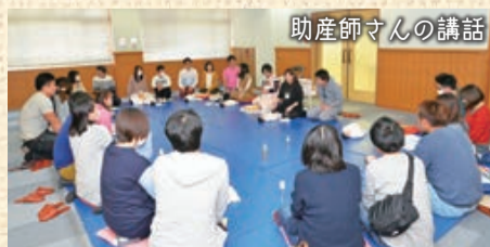
助産師さんの講話