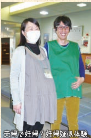
夫婦と妊婦? 妊婦疑似体験

まずは、妊婦疑似体験。お腹にずっしりと重りをつけると妊娠8か月の「妊夫」さんが出来上がりました。「苦しいんですね。歩く時も足元が見えないし」パパたちもママの大変さわかっていただけましたか? 続いて、赤ちゃんの沐浴、授乳、おむつ替え、あやし方を赤ちゃん人形を使って実習します。大きな手で、やさしく、そしてちょっとこちなく慎重にお風呂に入れるパパ。その様子を笑顔で見つめるママ。お腹で赤ちゃんを育てている女性と違い、男性は父親になる実感を持ちにくいと言われます。プレママクラスに参加するなど、生まれてくる赤ちゃんを夫婦が協力して迎えようとする姿は、微笑ましく、取材している私まで温かい気持ちになった一日でした。