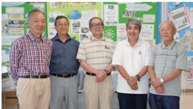
優しい笑顔の源は熱意に満ちた使命感

(評)のどかな日差しの中「いんざいぶらり川めぐり」の船が進む横で、憩うハクチョウの親子の姿が微笑ましい。そんなほらかな印象と共に、自然の中に息づく生命の営みを上手く切り取った視点も素晴らしい。