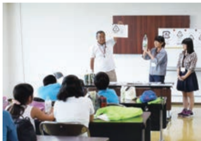
8月の親子向け見学会は夏休みの自由研究におすすめです