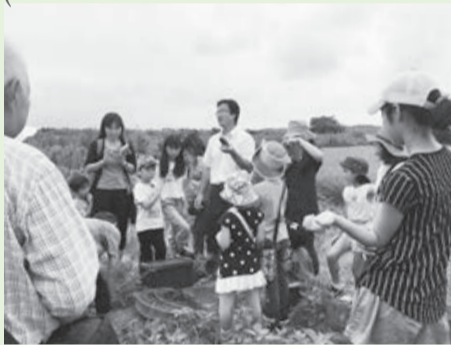
昨年の「カミツキガメを見よう」