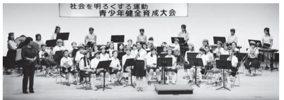
響き渡る子どもたちの演奏が大会を盛り上げます

よる作文朗読、市内小中学校、市民団体による演奏 ¥無料 他 託児コーナーあり(3歳以上の未就学児)。会場では手話通訳と要約筆記が行われます ☎「少年非行などの悩みについて」千葉保護観察所(☎043・204・7791) 「大会について」社会福祉課厚生係(☎33・4513)、生涯学習課推進係(☎33・4713)