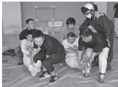
負傷者を皆で安全に搬送

訓練は、6月23日7時50分、千葉県東方沖を震源とする地震が発生、市内で震度5強を観測した想定で、参集メールを配信。職員は災害に伴う道路の寸断、交通渋滞などにより公共機関、自家用車が使用不可能な場合を想定し、徒歩、自転車、オートバイによる参集所要時間を検証しました。