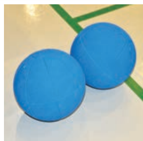
鈴が入ったボール

ゴールボールをプレーするときは、ラインやボールを目で確認することはできません。試合中にアイシェードを外したり触るとペナルティとなります。そのため、ラインのテープの下にタコ糸を入れてでこぼこをつけ、手や足で触って確認できるようになってます。また、ボールがどこから来るかは、鈴の音だけが頼りとなるため、とても集中力が必要とされるスポーツです。