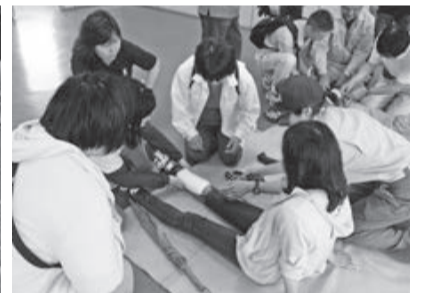
身近なものを添え木替わりに

また、印西地区消防組合の協力による簡易トイレの設営や、応急救護・負傷者搬送訓練、煙体験などを実施しました。