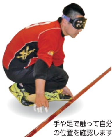
手や足で触って自分の位置を確認します

日本では、1982年に東京都立文京盲学校で競技が紹介され、1992年に全国のスポーツセンターでゴールボール教室が開催されるようになり、その後も競技の啓発と競技者の育成などに取り組まれています。