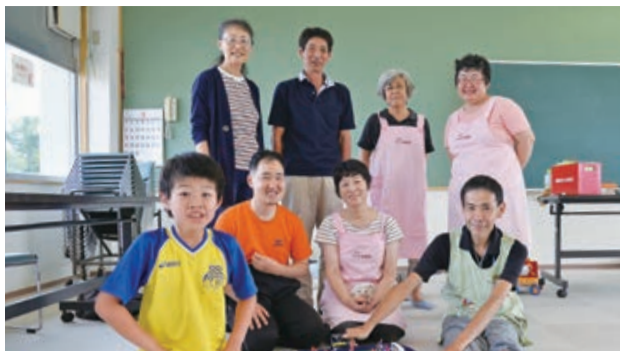
ボランティア会員の皆さん…自宅に眠っている乾電池がありましたらご提供いただけませんか

(評)別所地区に受け継がれている「別所の獅子舞」を撮影した躍動感あふれる作品。「別所の獅子舞」は約800年前から伝承されているという三匹獅子舞。笛の音に乗り、時に軽快に、時に勇壮に舞い踊るその姿をよく捉えている。