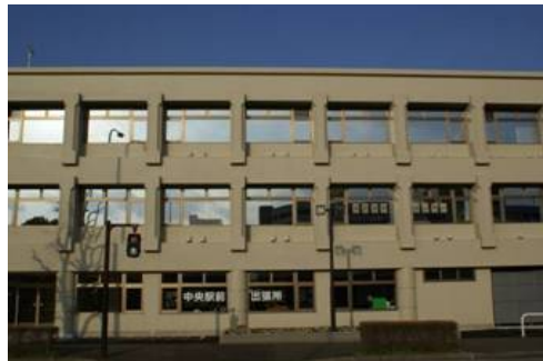
図3 中央駅前地域交流館2号館