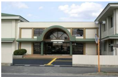
図2 中央駅前地域交流館1号館

中央駅前地域交流館は、市民の交流機会の創出、自発的な学習活動等の促進をもって、健全で生き生きとした市民生活の形成に寄与することを目的とした施設で、中央駅前出張所、市民活動支援センター、市民安全センター、ファミリーサポートセンターを含む複合施設です。場所は、(仮称)千葉ニュータウン中央駅圏複合施設の計画地に隣接しています(p2の「図1 計画位置図」参照)。