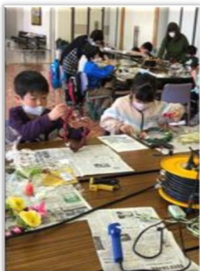
寺子屋&子ども食堂”さくら”さんの活動から リース作りに取り組んだ1コマ