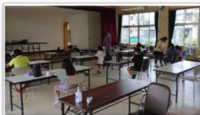
社会福祉協議会大森・永治支部さんの活動から 学習風景の1コマ