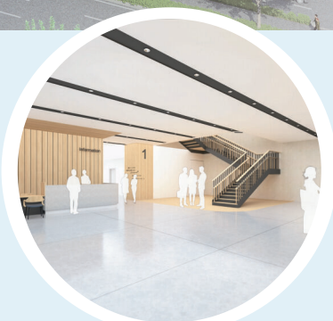
暖かい色調のエントランス