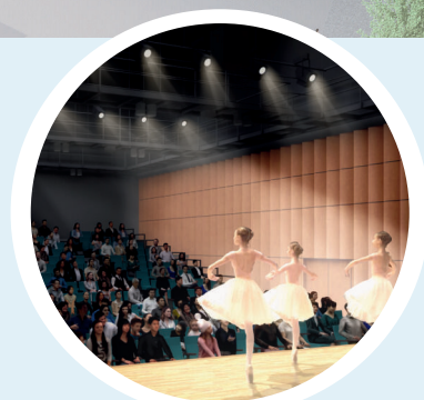
ステージで発表会