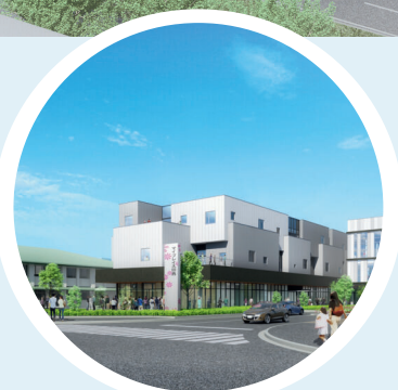
開放的で気軽に立ち寄れる