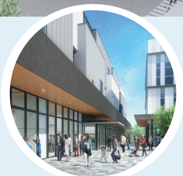
人が集い賑わいを創出