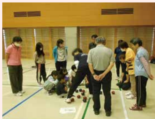
▲印西市スポーツフェス2023ポッチャ大会での試合風景

活動内容としては、ニュースポーツと呼ばれるモルック、ペタンク、ポッチャ、クロリティーを行っています。どの種目も得点を競うものですが、勝負には拘らず、失敗やミスを繰り返しながらも楽しく活動をしています。いずれも軽い運動なので気軽に参加できるスポーツです。ポッチャでは「2023スポーツフェス印西」に無謀ながら参加し、望外の準優勝をしてしまいました。どんな事でも最初は「初心者」です。見学や体験は大歓迎ですので一度遊びに来てもらえたらと思います。休憩時には、女性は近所のスーパーの情報、男性は病気自慢などを語り合いながら、みんなにぎわっています。「明るく・楽しく」に「元気よく」を加えて、これからも続けていきたいと思っています。