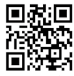
エックス▲ (旧ツイッター)