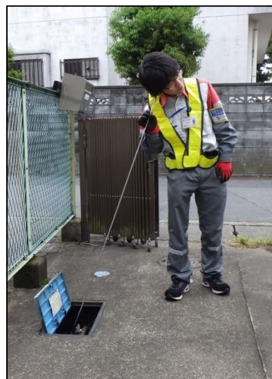
（参考）漏水調査イメージ写真