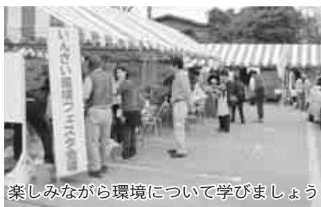
楽しみながら環境について学びましょう