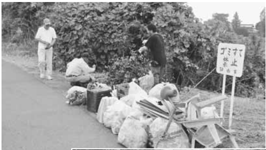
▲ 安食ト杭地区のみなさん(左)と師戸地区のみなさん