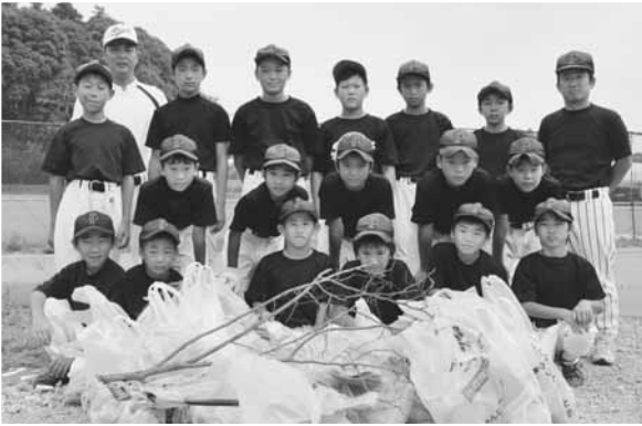
▲ チームで参加してくださった別所の少年野球チーム「印西フェニックス」のみなさん