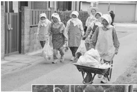
▲▲ 辺田前地区のみなさん(上)と岩戸地区のみなさん