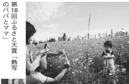
第18回ふるさと大賞「熟写のパパとママ」