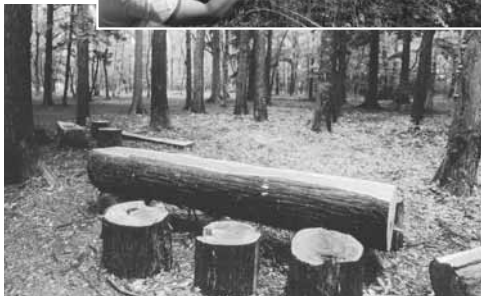
第18回優秀賞「森のベンチ」