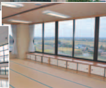
情報学習室からは遠く本埜の田園などが一望に

ありました。バレーボールやバドミントンなど体育館としての利用はもちろんです。観覧席を備えた舞台もあり、各種イベントなど多目的に利用できる明るく開放的な感じの施設でした。 最後に4階に上がると、情報学習室と表示された25畳の和室がありました。床の間を有する部屋のカーテンを開け放つと、この館一番の眺望が