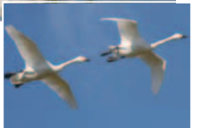
本埜の青空に映える白鳥たちの優雅な舞。訪れた人々を魅了してやみません

Kテレビ『小さな旅』で紹介され、15万人もの見物客が訪れ、ごみのポイ捨て、車の渋滞が問題に。 人も白鳥も環境破壊の波に押しつぶされそうになりましたが、地域のボランティアの