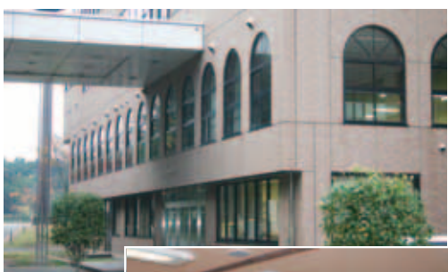
合併前は「本埜ふれあいプラザ」でしたが現在は「本埜公民館」として使用されています

ートなどを備える本埜スポーツプラザの一角にありました。地上4階、外壁が赤レンガ風タイルで周囲の緑にマッチした建物でした。 当日、宮嶋館長に施設の案内をしていただきながらお話を伺いました。周囲の運動場などで構成される「本埜スポーツプラザ」が平成4年にオープン。その管理棟を兼ねた施設として現在の公民館が完成し、総称として「本埜ふれあいプラザ」が平成9年にできたということでした。 まず利用頻度が一番という1階の音楽室は、ピアノ1台を備え、壁には等身大の鏡があり、楽器演奏や合唱練習などのほかに社交ダンスなど多方面の活用ができるとのことでした。また、3階には広大なスペースの多目的ホールが