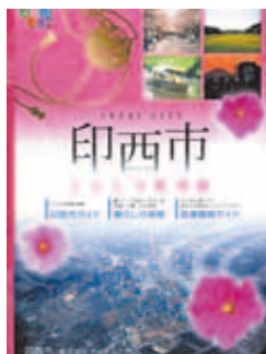
▲「印西市くらしの便利帳」の表紙(見本)