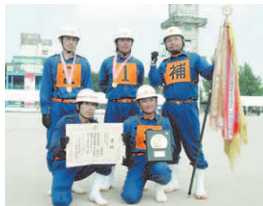
▶猛暑に負けず見事優勝にがやき、全国大会出場を決めた印西市消防団の選手のみならず

印旛支部操法大会ポンプ車・小型ポンプの両部門で優勝した印西市消防団が、7月24日に開催された千葉県消防操法大会に出場。小型ポンプの部で、出場消防団中最高得点を修め最優秀賞に輝きました。