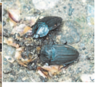
▲葬儀屋兼掃除屋のオオヒラタシテムシ

はありませんが、彼らの仲間がいなくて地球上が生物の死がいで溢れ返ってしまうとか。明るい日の光が差し込む広葉樹林に接して、薄暗い針葉樹林部分が広がっています。スギやヒノキの森は生き物の数も少なく、どことなく不自然な感じを受けるのは、わたしだけでしょうか。 どんな生き物も自然が破壊され、自分に合った食べ物が無くなれば死滅する。約3時間の探検でしたが、子どもも大人も有意義な時間を過ごせたことと思います。 子どもたちが野の花や樹木、チョウやクワガタ、野鳥などに興味を持ち、大人になっても忘れなければ、伊西の自然はきっと守られることでしょう。