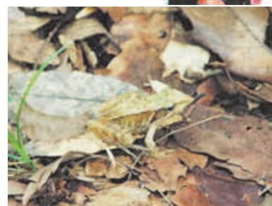
▲森の中には昆虫だけでなくカエルも(写真はニホンアカガエル)

ストラン。虫たちを餌とする野鳥も集まります。 今回の探検では昆虫だけでなく、湿った下草の中に、最近見ることも少なくなったニホンアカガエルも見つかりました。また森の小道には、動