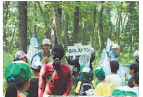
探検隊のガイド役「ウエットランドガイド」のみなさん

「なに?この黒い虫」 「きゃー、カエルがいる!」 夏休みが始まったばかりの7月23日、朝から森の中に子どもたちの嬌声が響きわたります。 「草深の森で夏の昆虫を見つけよう」というテーマで、夏休みの子どもたちを対象に行われた催しです。今年約50人の児童・保護者と10人の指導者のみなさんが参加しました。 自然探検隊は「さまざまな生き物を守る」環境について学び、理解する」といった、 「伊西市環境基本計画」の中の取り組みの一つです。 会場となった草深の森は、住宅地に隣接して残っている自然林で、さまざまな樹木が生い茂る広葉樹林部分と、昔の植林の名残が、スギやヒノキの針葉樹林部分があります。広葉樹林部分には、クヌギやコナラといったドングリを付ける木が多くあり、その木から出る樹液を求めてカブトムシなどの甲虫や、チョウやハチなどいろいろな昆虫がやってきます。樹液の出るドングリの木は、まさに森の中のレ