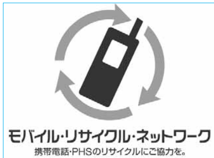
モバイル・リサイクル・ネットワーク

携帯電話をリサイクル 携帯電話・PHS端末には、金、銀、銅などの希少金属が含まれており、貴重な資源として再利用が可能です。