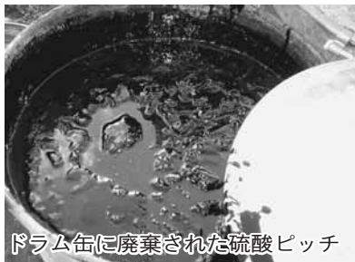
ドラム缶に廃棄された硫酸ピッチ

市では、監視カメラの設置やパトロールの実施などにより、大規模な不法投棄は減少しました。しかし、依然として悪質な不法投棄は後を絶ちません。