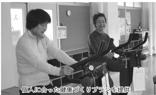
個人に合った健康づくりプランを提供

市では一人ひとりの健康状態や生活習慣に応じて、科学的根拠に基づく健康づくりプランを提供する「ヘルスアップ教室(健康生活コーデイナー事業)」を実施しています。