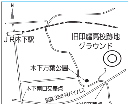
旧印旛高校跡地グラウンド