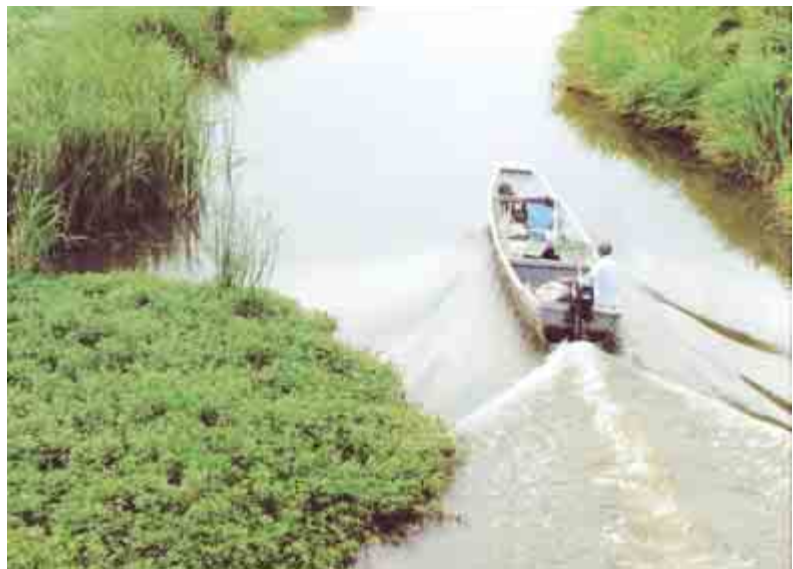
◆佳作 ◆亀成川の寸景 (亀成) ◆澤田博愛 (大森)

(評) 川魚漁師が操る船のスクリーンの航跡をうまく表現した見るからに涼げな作品。