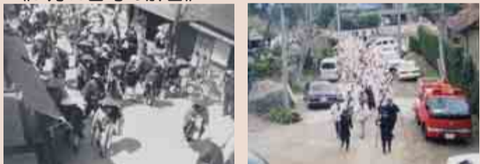
▲答えは「印西大師」(右写真は最近のもの)。白いお遍路さんの服装は近年になって定着したそうです。