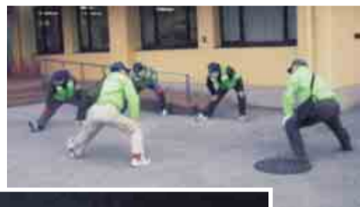
出発前にまず十分な準備体操