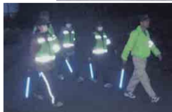
暗くなり灯りのついた誘導灯が目立ちます

苦勞さまです」と挨拶してきます。不審者がいないか、不審車両がないかチェックしながらのパトロールです。原山中学校の後ろの緑道を通り戸建ての住宅地を抜けると、国道464号です。国道沿いに歩き約1時間30分のパトロールでした。途中、女性隊員にパトロール隊員になった動機を伺ったところ「子どもを守るために始めたが、身体にも良いので今後も続けていきたい」と元気な返事をいただきました。