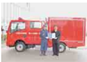
▲消火機材以外にも救助機材が搭載された消防車

平成21年度事業として、総務省消防庁が全国の消防団に向け「救助資機材搭載型消防車両」の配備を行いました。関東地区では、57台が配置さ