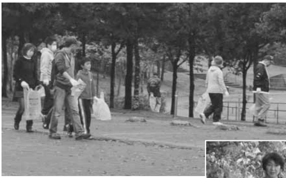
◀◀前日の悪天候が尾を引く中、たくさんの方の市民のみなさんがゴミゼロ運動に参加してくださいました