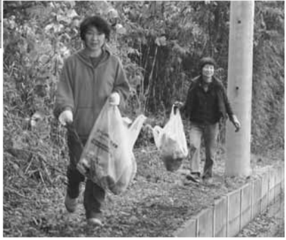
◀一つのごみが別のごみを呼び込むきっかけに。これを防ぐには、わたしたち一人ひとりがルールを守り、ごみを管理しなければなりません