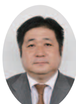
印西市議会議長 金丸和史

昨年3月に発生した東日本大震災は、いまだ国民生活や産業・経済に深いつめ跡を残しています。被災されたみなさまには、あらためてお見舞いを申し上げますとともに、義援金や救済物資のご提供をいただきまして、心からお礼を申し上げます。