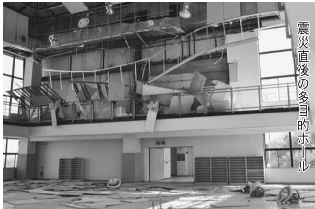
震災直後の多目的ホール

コート・多目的広場)。 ●バス振興課振興班(松山下公園総合体育館内・☎④8417)。