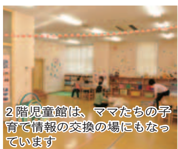
2階児童館は、ママたちの子育て情報の交換の場にもなっています

大の医師および順天堂大学生の協力による健康チェック、また、スタッフによる体力測定をもとに作られた個人別の運動プログラムなどのデータはパソコンで管理され、TGS(テクノジムシステム)キーに保存されます。このキーが1本あれば、トレーニングルームのランニングやバイクなどの器具がいつでも使えます。 ちなみに現在の登録会員数は3,900人弱。その70%は65歳以上で、最高齢は90歳とか。センターが目指す中高年齢の運動習慣づくりが着実に進んでいるのが、うかがえます。 2階奥のいんば児童館も、周辺の乳幼児と育児ママ、午後は小・中学生でにぎわっています。1日平均で30組60人、多い時は100人を超し、土・日曜日には話題のイクメンも多いため、核家族化するなかで、若い世代の子育て支援、特に母親同士の交流・友達の出張つくりなどに、保育士さんたち7人が奮闘していました。 3階には福祉活動や住民交流の場として使える研修室などもあり、一大複合施設となっています。 印旛図書館(☎03-8550)、健康づくりセンター(☎03-900)、いんば児童館(☎03-950)・印西市美瀬1-2-5。