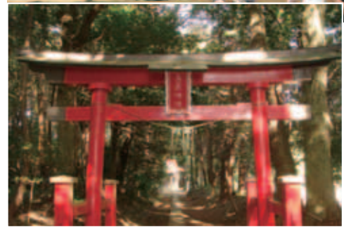
◀神楽が行われる中根の鳥見神社

この神楽の見せ場は、ひょっとこが「まるめ餅」を見物人に投げやるシーンにあります。