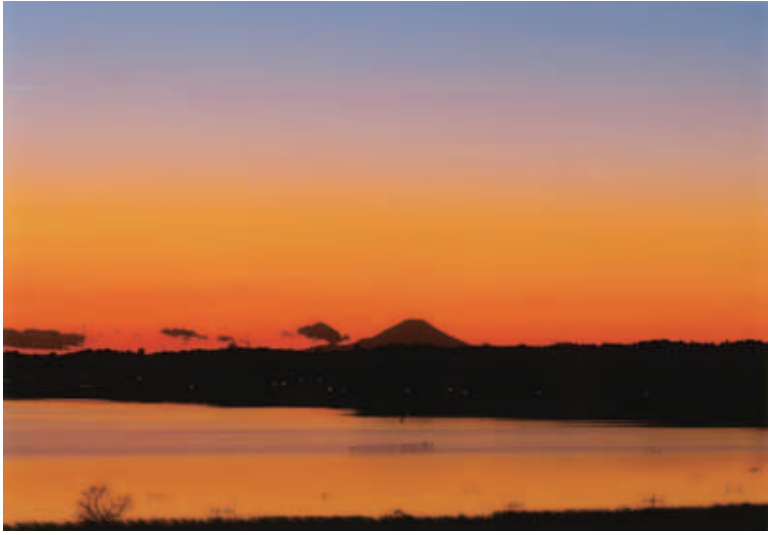
◆佳作 ◆徳性院眺望 (瀬戸) ◆菊池善則 (佐倉市) (評) 遠く夕日に浮かぶ富士と水辺の静けさが1日の終わりをゆっくりと伝える心穏やかな作品