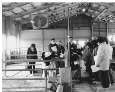
▲酪農の現場を実際に見学します(写真は昨年のもので)

「花の丘マンスリーコンサート」 「こんぺいとう菜の花コンサート」 パンフルートとギターによる演奏。出演：こんぺいとう。 ☎2月12日(日)・午後1時～2時。 【緑の教室】 「雪割草の育て方とこけ玉作り」 1年を通しての雪割草の魅力と育て方を学びましょう。『愛らしい雪割草のこけ玉作り』のお持ち帰り用実習付きです。 ☎3月4日(日)・午後1時30分～