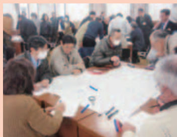
▲減災マップ作りに真剣に取り組む自主防災組織のみなさん

市では、今後も自主防災組織の活性化と地域防災力の向上に、努めていきたいと考えています。 ☎防災課防災班(☎内線451～454)。