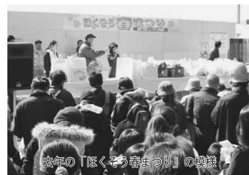
去年の「ほくそつ春まつり」の模様

●未就学児の入場はご遠慮ください。 ●各プレイガイドで売り切れの際は、文化ホールへお問い合わせください。 ●※電話予約の受け付けは、文化ホールのみです。