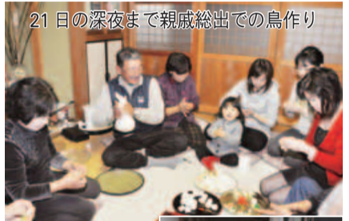
21日の深夜まで親戚総出での鳥作り