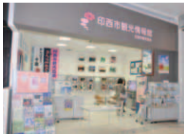
▲豊富な観光情報が盛りだくさんの「印西市観光情報館」

印西市観光情報館は、イオンモール千葉ニュータウン店の1階にあり、年中無休で午前10時〜午後6時までの開館