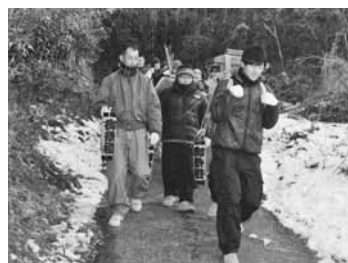
雪が残る中、背負い神輿を先頭に浦部三地区を回る「初囃子」